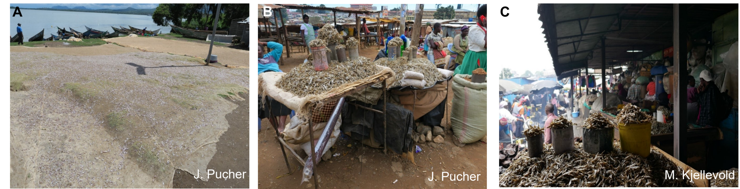
Abbildung 2: A: Trocknen von Rastrineobola argentea (Omena) in der Sonne; B und C: Beispiele von Märkten.